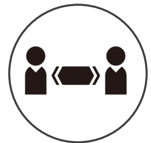
ソーシャルディスタンス

※一部急なご予約無しのご来店のお客様へ対応する可能性はございますことご容赦ください。