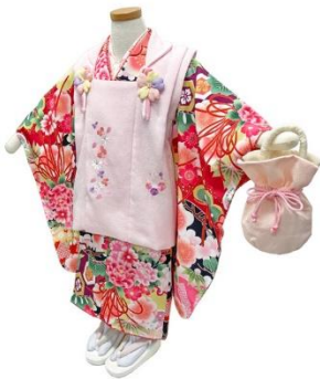
▲3歳女の子（式部浪漫）

多様なお祝いの仕方が増える中、それぞれの家族に合った形で、多くの選択肢から好みの衣装をゆっくりお選びいただけるよう、新柄を追加いたしました。定番人気の吉祥文様から、モダンな柄までフルセットでご用意。お気に入りの一着を見つけてください。